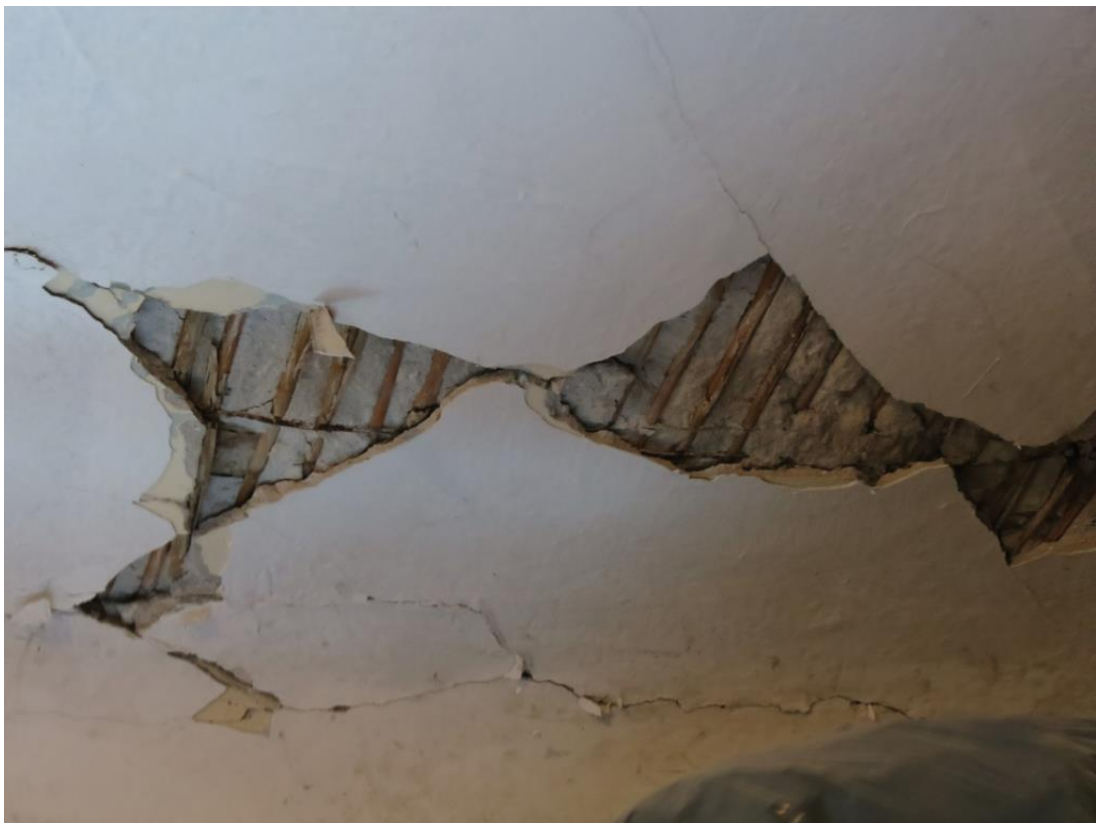
Odpadli večji kosi ometa na stropu v Vinjem Vrhu.