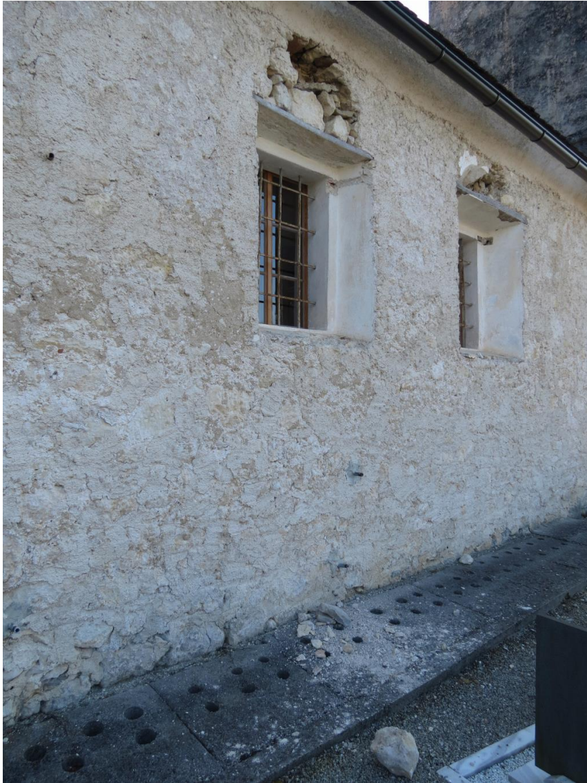
Globoka razpoka na zunanji strani cerkve v Bušeči vasi