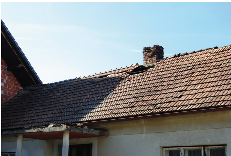
Odlom dimnika na družinski hiši, Hrastje pri Cerkljah