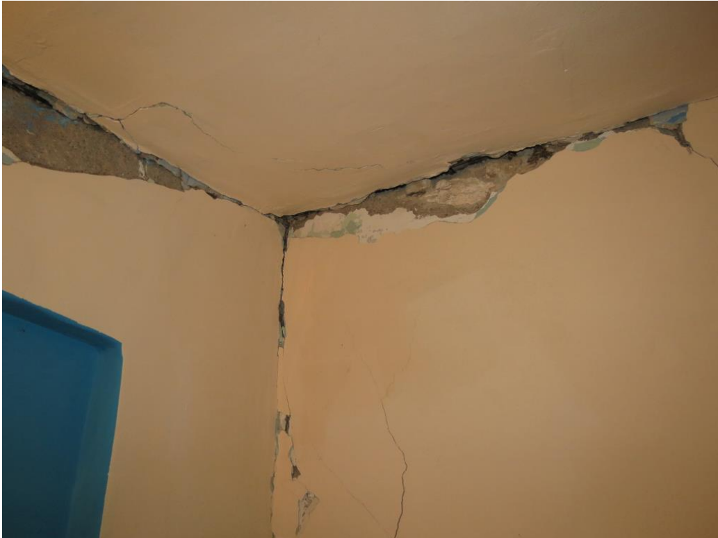
Široke in globoke razpoke na stikih nosilnih zidov in stropa na Stojanskem Vrh