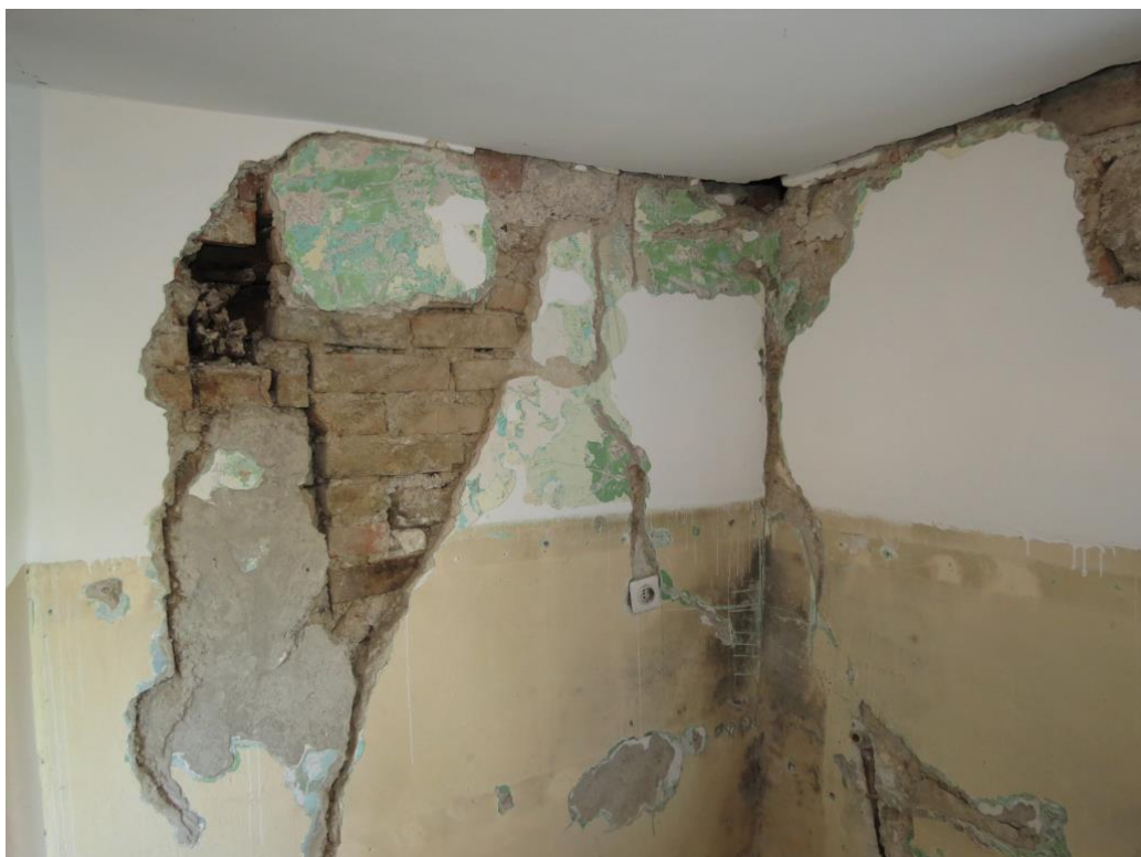
Široke in globoke razpoke nosilnih zidov na Stojanskem Vrh