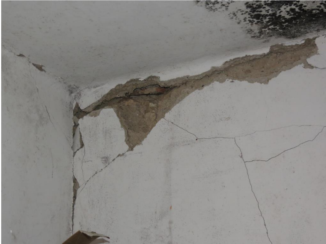
Široke in globoke razpoke nosilnega zidu na Vinjem Vrhu