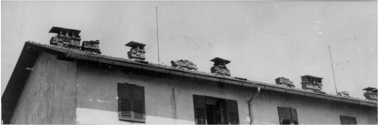
Poškodovani dimniki v Litiji.