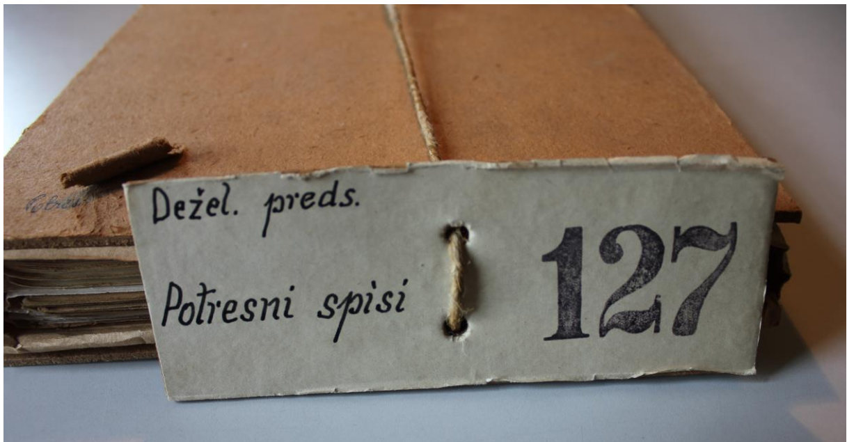
Poročila o škodi po potresu v Brežicah 29. januarja 1917 (hrani Arhiv Slovenije).