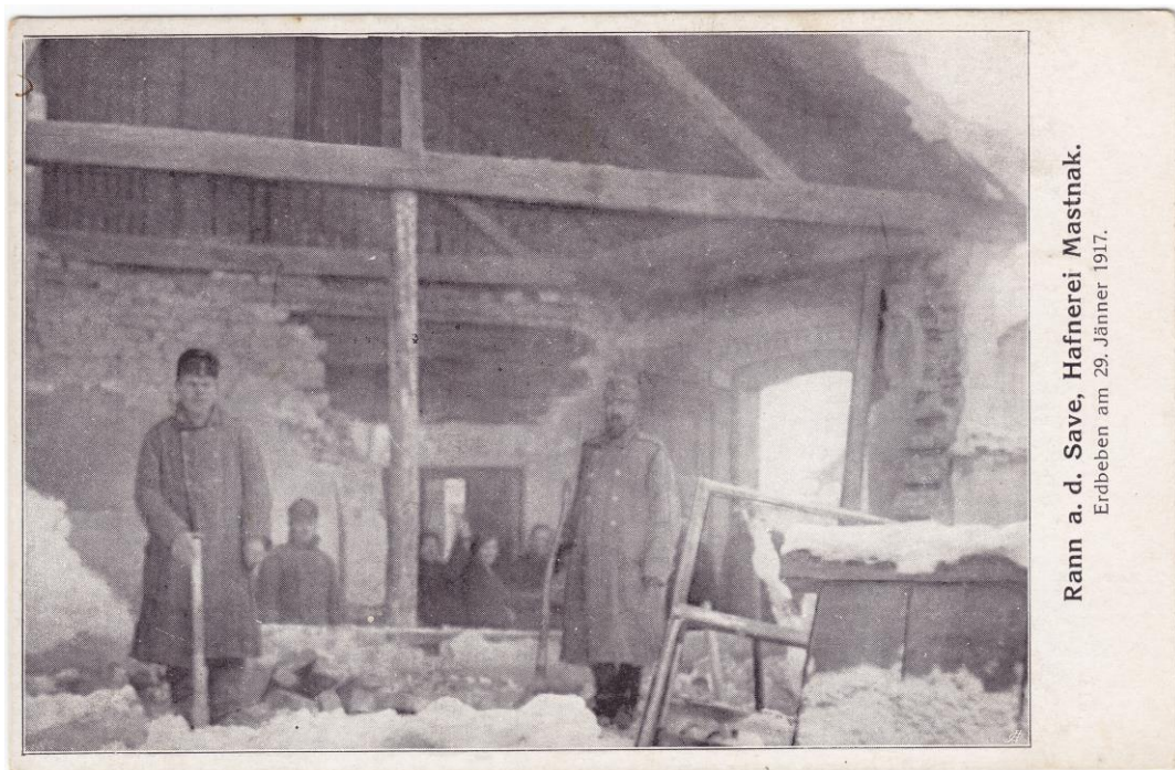
Poškodovana Mastnakova hiša v Brežicah.