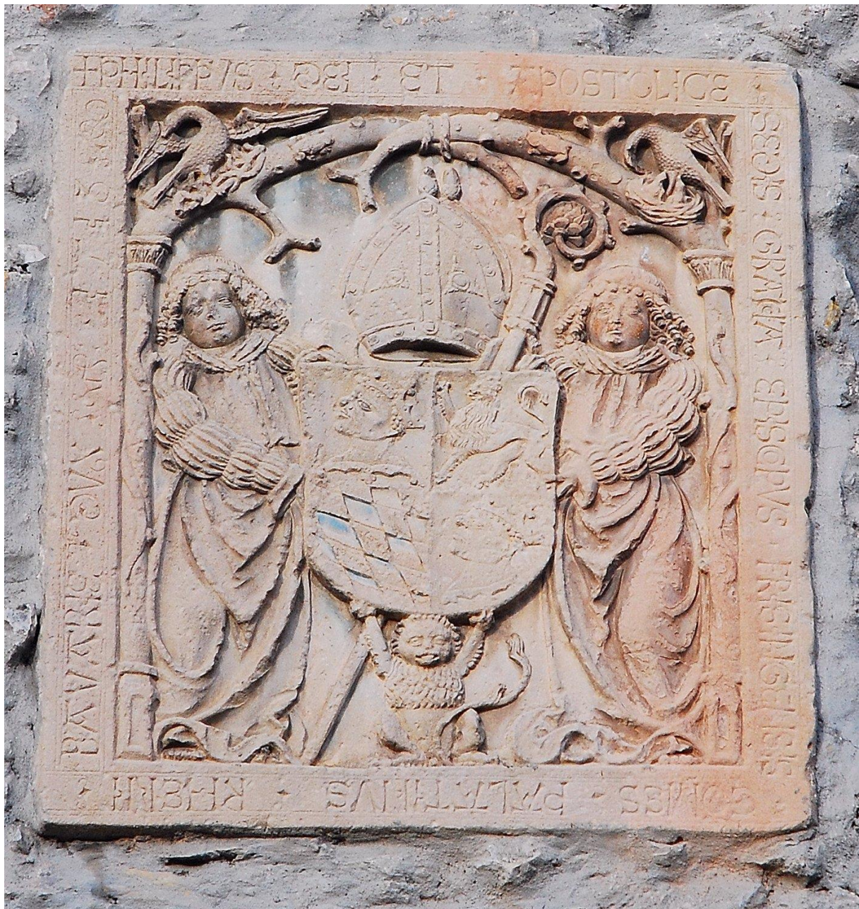
Plošča, vzdana na grajski kašči škofjeloškega gradu, spominja na obnovo gradu po potresu leta 1511 (Makroseizmični arhiv, ARSO).